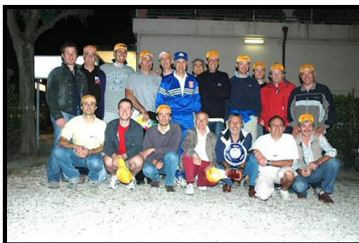
Il gruppo TurBike alla Nove Colli.