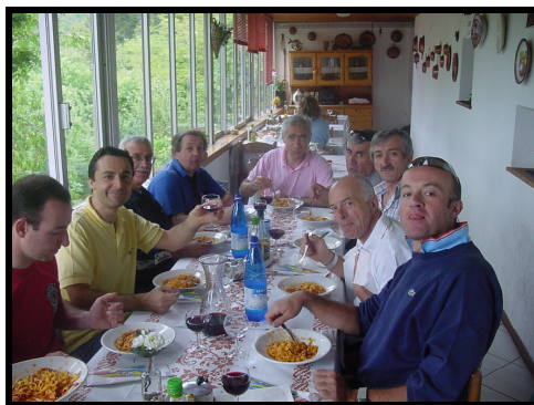
Pranzo a Verghereto durante il viaggio di andata..